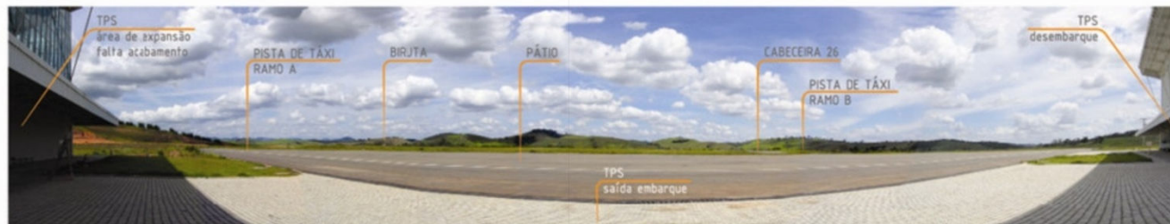
05 - ÁREA DE MANOBRAS