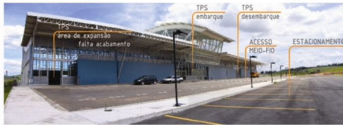
02 - TPS, MEIO-FIO E ESTACIONAMENTO - LADO TERRA