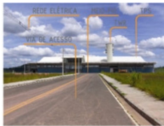
01 - ACESSO E TPS - LADO TERRA