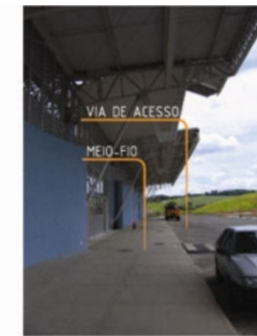
03 - MEIO-FIO